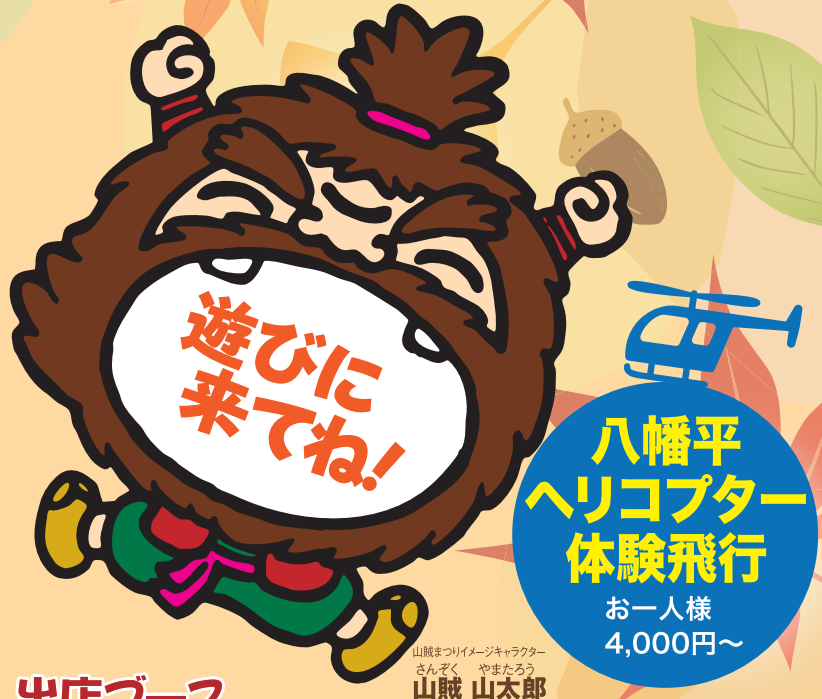
山賊まつりイメージキャラクター さんぞく やまたらう 山賊 山太郎